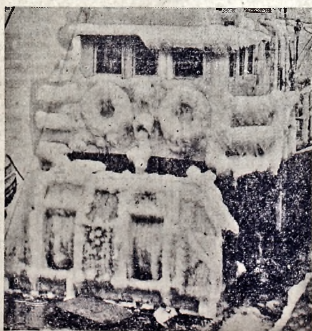
18 ЖЕРТВ У РИБАЦЬКІЙ КАТАСТРОФІ

Покритий ледом корабель, що прибув до пристані в Бостоні, врятувавши на морі п'ятьох рибаків з затопленого рибачього човна. При катастрофі, що сталася наслідком зудару рибачього човна з невідомим кораблем, втопилось 18 рибаків.