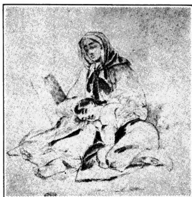
Образець цей намальований Тарасом Шевченком