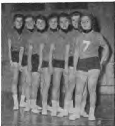
Дівоча ланка відбиванки і футбольні юніори (внизу) СК СУМА «Крила» в Шікаґо.

І так від скромних та неспівливих перших кроків з-перед семи років, записують ці