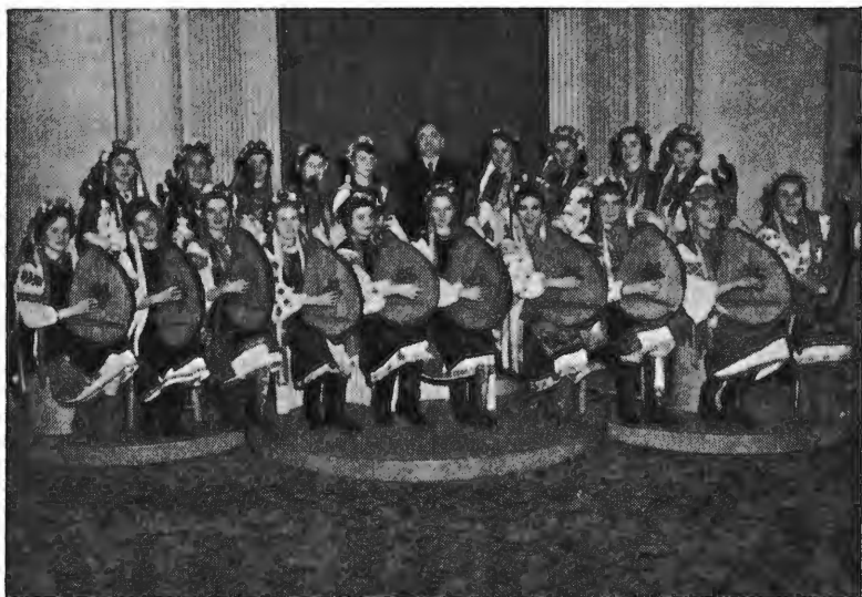
Ансамбль бандуристок із своїм диригентом

Ансамбль бандуристок при Осередку СУМА ім. П. Орлика в Дітройті, ЗДА.