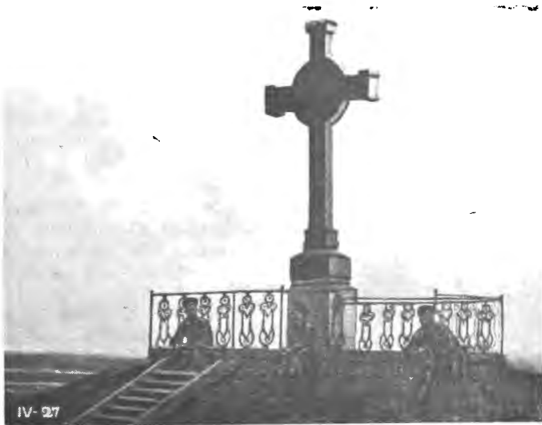
Могила Т. Шевченка під Каневом над Дніпром в 1914 р.

Московські жандарми сидять на могилі, щоб не дозволити українцям шанувати тут пам'ять великого співця. Ще й по смерті пророка лякалася й лякається Москва його огненного слова про волю.