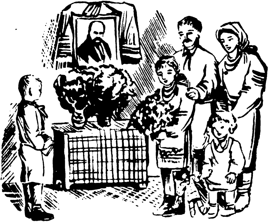
Рис. В. Валяса

Та ще один вінок плетем ми, — З любови чистої, мов квіт. Нас не злякають бурі й темні — Нам світить ясно Заповіт! М. Дяченко