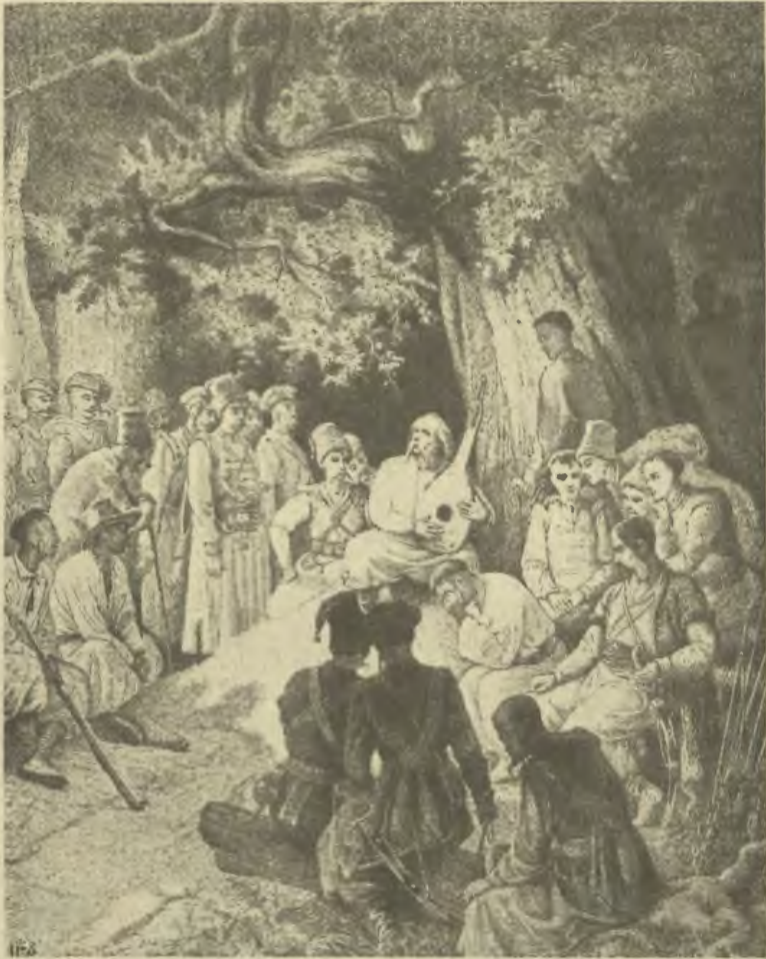
Кобзар. Ілюстрація до поеми „Гайдамаки” Т. Шевченка Мал. О. Сластьона