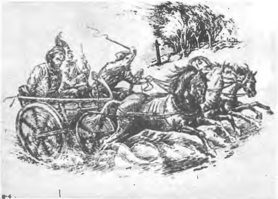
Жандарм везе скованого Т. Шевченка на заслання