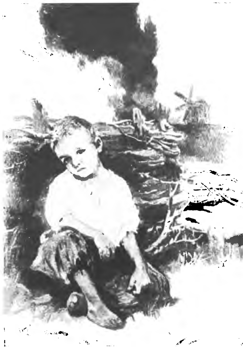
Т. Шевченко дитиною