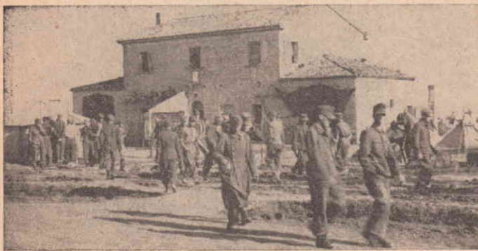
Таборовий штаб «Олімп» в таборі Белярія

Вже в нашому першому розділі ми вказали на неможливість об'єктивного*) представлення українського військового руху в російській армії 1917 року через недостатність джерел. Документи про розклад російської армії, також за національними ознаками, знаходяться в советських архівосховищах, які нам є недоступні, а советські історичні публікації, здебільшого, промовчують факти про національний розклад армії, або дають його далеко неповну картину (А. Е. Какурин, Разложение армии в 1917 году, Москва-Ленінград, 1925 ). Знов же, українська мемуаристична література є, по суті, незначна своєю кількістю і бідна на факти. Цих кільканадцять статей і заміток, що їх про український військовий рух у російській армії 1917 року опубліковано в нашій літературі, — це так жалюво мало, що аж соромно про те говорити. Але ця нехитість